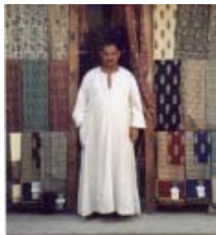
Un commerciante indiano

riguardo. Il Brasile ha adottato una maggiore tassazione sulle importazioni che ha generato una duplicazione dei prezzi dei prodotti tessili e di abbigliamento provenienti dall'estero. L'Egitto ha ridotto le limitazioni alle importazio-