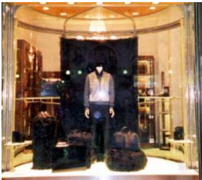
Articoli da viaggio in pelle della nuova linea Prada

Il mercato della pella negli Stati Uniti non sembra per ora prossimo ad una veloce ripresa. La crisi dell'economia mondiale ha inferto un duro colpo al settore, in particolare per quanto riguarda gli articoli in pelle di fascia alta. Secondo gli ultimi dati dell'Istituto Italiano per il Commercio Estero, il mercato della piccola pelletteria, cinture, guanti e muffole, e' stato il meno colpito dalla crisi economica e dagli avvenimenti dell'11 settembre. Tale mercato sta lentamente riguadagnando terreno e la crescita dovrebbe continuare fino al 2006, accumulando di anno in anno un tasso di crescita previsto tra l'1 per cento e il 5 per cento. I consumatori americani spendono molto meno in viaggi —quello del turismo e delle compagnie aeree e' stato uno dei settori con la peggiore performance negli ultimi die anni— e di conseguenza le spese in valigeria e accessori da viaggio ne hanno risentito. Un fattore da considerare e' anche il fatto che il lusso ha perso parte del suo carattere esclusivo alterando il profilo del consumatore dei cosiddetti prodotti di lusso, non piu' destinati solo ad una elite. Questo passaggio di fascia e' piu' comune in categorie come la piccola pelletteria dove anche gli oggetti piu' costosi non hanno l'alto prezzo di esposizione di una valigia o un baule in pelle.