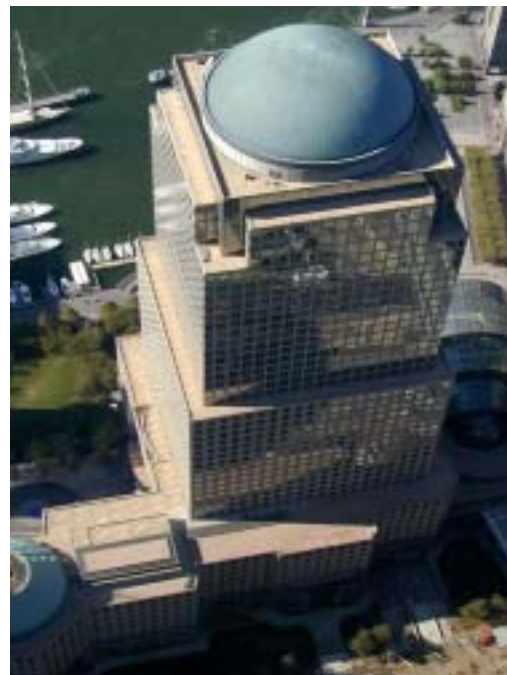
Il quartier generale di Merrill Lynch a New York

Anche le aspettative per il mese di aprile e più in generale per il primo trimestre dell'anno fiscale in corso domina il pessimismo tra gli analisti. Nonostante l'ottimismo di gestori e rivenditori, che prevedono un aumento delle vendite compreso fra l'1% e il 3% (nell'aprile 2002 è stato pari a +0,9%), rimane elevato il rischio di una ripresa fiacca se non nulla. Le a-