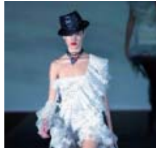
Un capo di Giambattista Valli

una cena in suo onore presso il ristorante di Barney, Greengrass. Tra gli ospiti della cena