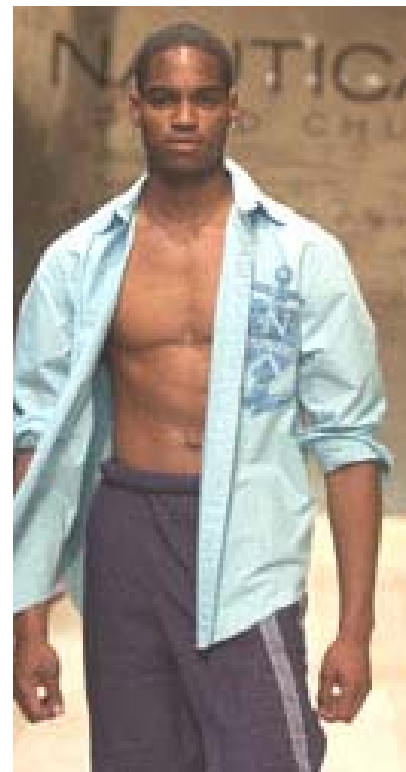
Un capo della nuova collezione Nautica