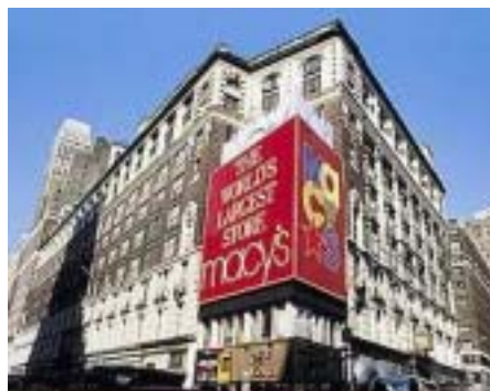
La nuova linea sarà disponibile anche da Macy's