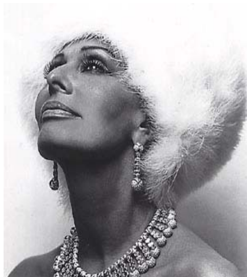
Sophia Loren con indosso un collier di Bulgari