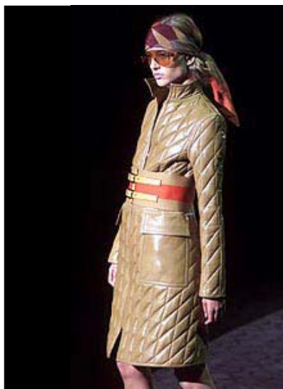
Un capo in pelle della collezione Gucci

sottoposti a forti pressioni in un mercato divenuto estremamente competitivo. In questo ultimo anno la lotta per accaparrarsi una fetta del mercato della distribuzione è cresciuta notevolmente di intensità, soprattutto dal momento che i commercianti americani hanno preceduto con maggiore attenzione nella selezione degli acquisti, discriminando i marchi che non posseggono idee innovative e un forte supporto di marketing da parte della stessa azienda. In questo difficile panorama i prodotti italiani sembrano essere risultati vincenti. Sempre secondo i dati dell'ICE, le importazioni dall'Italia sono aumentate, in particolare per