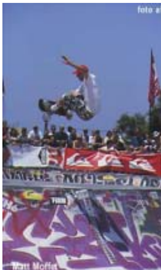
Un evento sponsorizzato dal gruppo