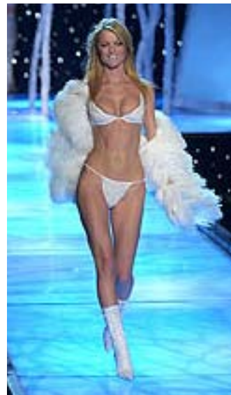
Una sfilata Victoria's Secret