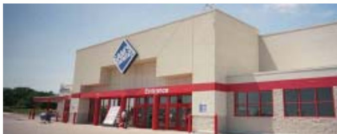
In alto: un punto vendita BJ's. In basso: l'ingresso di un Sam's Club

corrente di BJ's, un fattore questo che potrebbe minare la fattibilità di un accordo tra i due gruppi. Benedict ha inoltre sottolineato che vi sarebbero anche altri problemi, visto che le strategie delle due