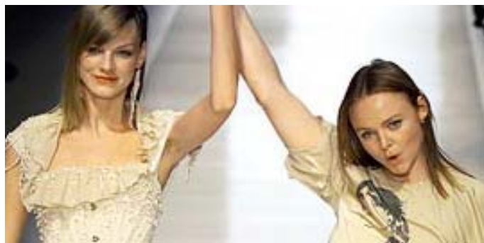
La stilista Stella McCartney alla fine della sfilata primavera/estate 2003

designer è la vegetazione circostante, importantissima per una vegetariana ed animalista convinta come la McCartney, che dal punto di vista degli affari significa anche privacy per i clienti vip che non vogliono essere disturbati da ammiratori e fotografi. Oltre all'apertura della terza boutique per Stella McCartney i piani per il futuro vedono il lancio di un profumo, di cui non si conosce ancora il nome, per il giugno prossimo, assieme alla promozione della collezione di scarpe che sono state presentate sulle passerelle del suo show e sulle cui soles è scritto "suitable for vegetarians"-adatte ai vegetariani. In tema anche il progetto di creare una collezione di accessori in materiale alternativo a quello di provenienza animale, una linea di cosmetici non testati su animali ed una di abbigliamento intimo.