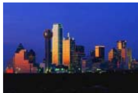
Una veduta della città di Dallas

acquistare una maglietta a soli 39 o 49 dollari. Alcuni clienti vengono qui a fare shopping ogni week end". In generale il prezzo va dai 40 ai 150 dollari: un affare per chi vuole avere uno stile trendy spendendo moderatamente. Jay spiega inoltre che Dallas si è rivelata una scelta azzeccata, essendo la città un mercato in espansione. Innanzitutto quello di espandere il negozio del West Village dagli attuali 170 metri quadri. E non solo. I proprietari hanno in mente di aprire anche altri 25 punti vendita in dieci stati nei prossimi due anni. Tra le destinazioni scelte, si mettono in luce Austin, Houston e San Antonio. La scelta è simile a quella di altri marchi europei, che si sono concentrati