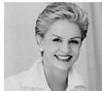
La designer Carolina Herrera

Infine l'attrice australiana Nicole Kidman verrà insignita del Fashion Icon Award, per la sua capacità di indossare al meglio le creazioni degli stilisti più diversi, da Karl Lagerfeld a Jean Paul Gaultier a Dior. In passato tale premio era stato assegnato a Lauren Bacall, Audrey Hepburn, Sophia Lauren ed Elizabeth Taylor.