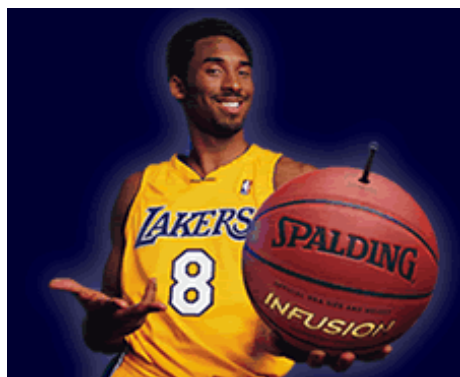
Un'immagine dal sito Internet di Spalding