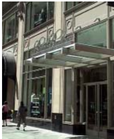
Negozio Brooks Brothers a San Francisco

all'abbigliamento femminile. La compagnia possiede oltre 200 negozi in tutti gli Stati Uniti, in Giappone, Hong Kong, Taiwan ed in Italia.