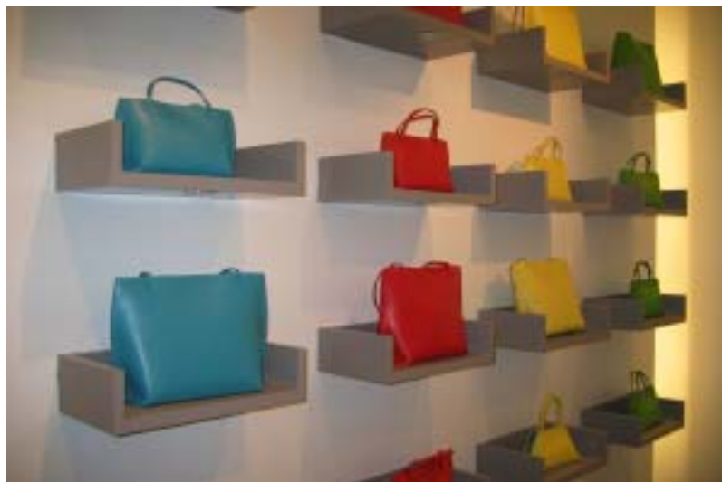
L'interno della boutique Furla a New York

tano oriente, in Francia oppure nel Far West. La nuova immagine sembra funzionare per la compagnia, essendo passata da "un giro d'affari di 20 milioni a quasi 90 milioni di dollari", secondo le dichiarazioni di Furlanetto.