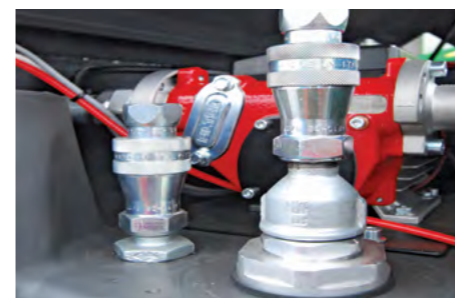
Kit di attacchi rapidi per collegamento a gruppi elettrogeni (tubo di aspirazione + attacchi rapidi di alimentazione e ritorno da 1/2"). n. 2 rapid couplings, size 1/2", for generator sets connection (feeding + return line+ suction pipe).