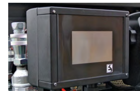
Sistema di allarme Emilprobe®. Emilprobe® alarm system.