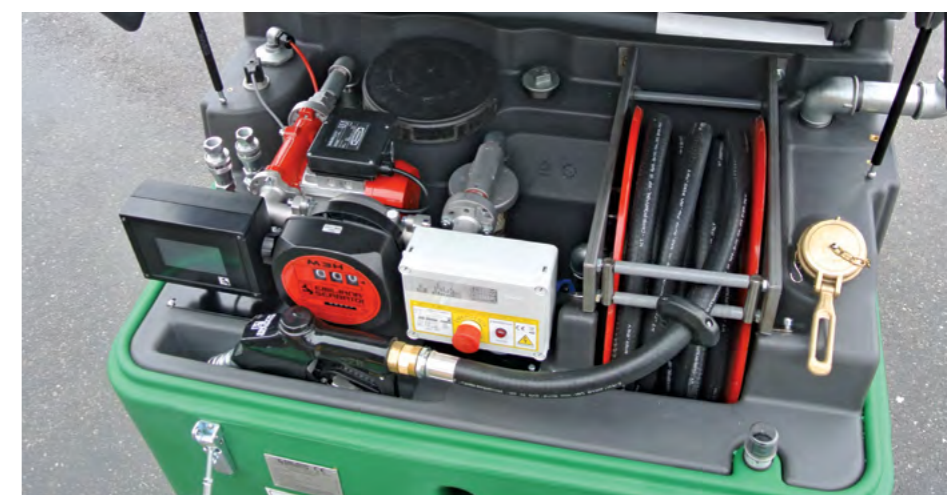
Il serbatoio con tutti gli optional installati. Tank with all accessories installed.