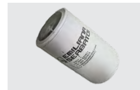
Filtro assorbimento acqua 60 l/min µ30. Water absorber filter (µ30) for flow-rates up to 60 l/m.