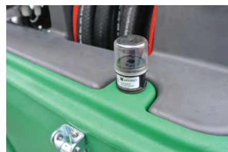
Monitoraggio intercapedine. Leak detector.