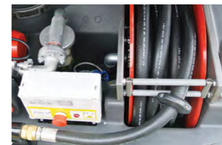
Il quadro elettrico e l'arrotolatore. Electric switchboard and spring rewind hose reel.