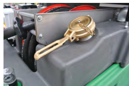
Il tappo di carico da 2". Filling quick cap 2".