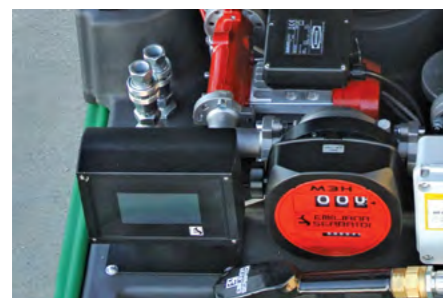
Il dispositivo Emilprobe®, il contaltri meccanico e i raccordi rapidi per la versione GE. Emilprobe® alarm system, mechanical flow meter and, on left, quick couplings for GE version.