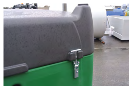
Dettaglio del coperchio con chiusura lucchettabile. Detail of the padlocked reinforced lid.