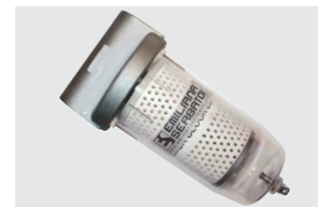
ES-Filter: 70 l/min; capacità filtrante: 10µm assorbimento acqua e 5µm impurità. ES-Filter: up to 70 l/min; Filtering capacity: 10µm water absorbing and 5µm impurities.