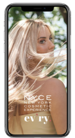
Social Media IG / FB