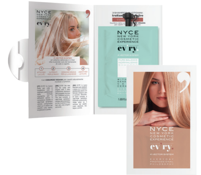
EV'RY - SACHET HOLDER & LEAFLET A5 UNIVERSAL 1=18 NYP1067