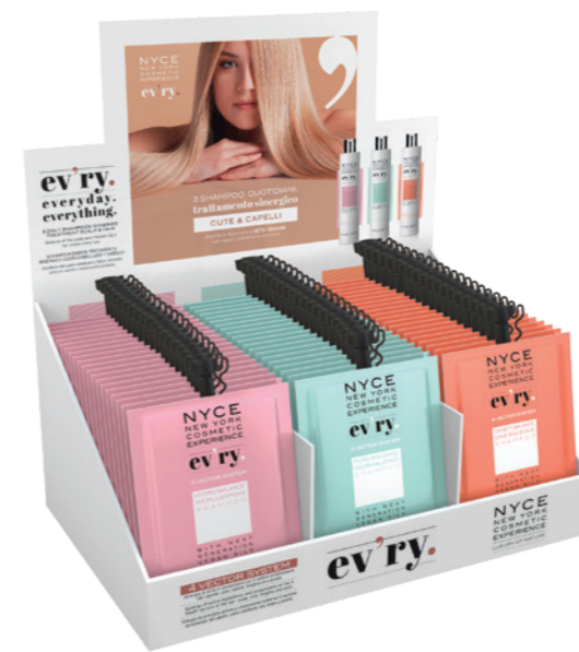
EV'RY - DISPLAY BOX 3 ref. x 12 pcs SACHETS 50 ml NYCEVRBOX001