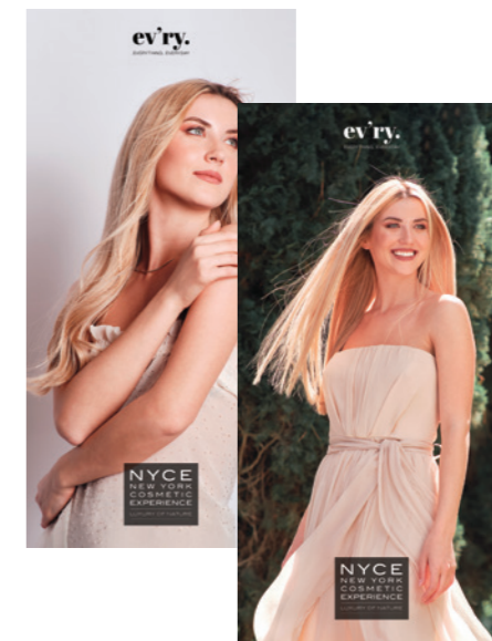
BOARD 50x100 F/R EV'RY NYP1079