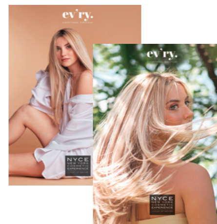
A3 PHOTO PAPER F/R EVRY NYP1069