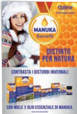
CARTELLO VETRINA WINDOW DISPLAY