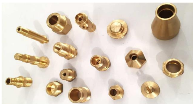
Centro di lavoro da barra con 8 assi virtuali e range di diametro fino a 42 mm 8-axis multi spindle lathe from bar and diameter range up to 42 mm