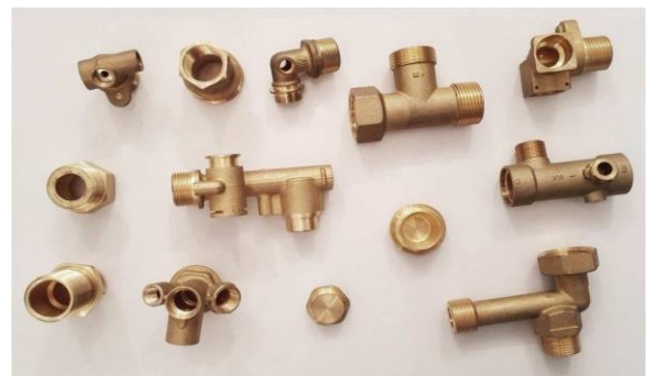
Centri di lavorazione CNC particolari che richiedono lavorazioni multiple di precisione CNC machine tools for components and articles that need various phase and precise machining