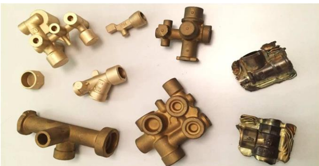
Stampaggio non ferrosi a caldo Non ferrous metal hot forging