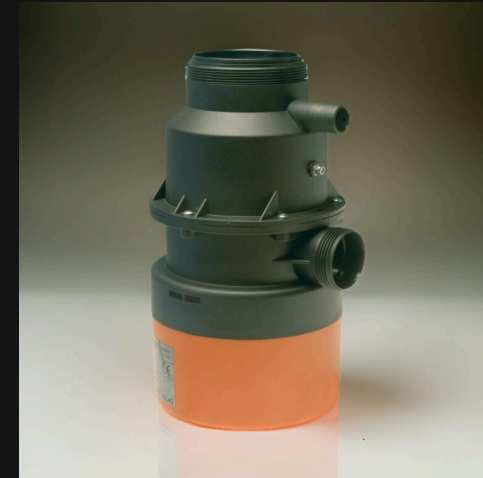
Prodotto VORTIX SMART — immagine illustrativa

Sequenza tipica; prestazioni e tempi possono variare in base alla configurazione.