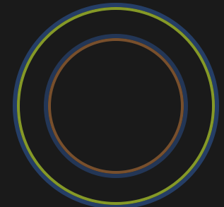
VORTIX SMART attivo