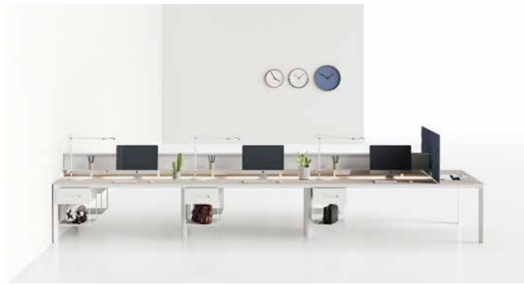
SEVENTY SEVEN design Progetto CMR