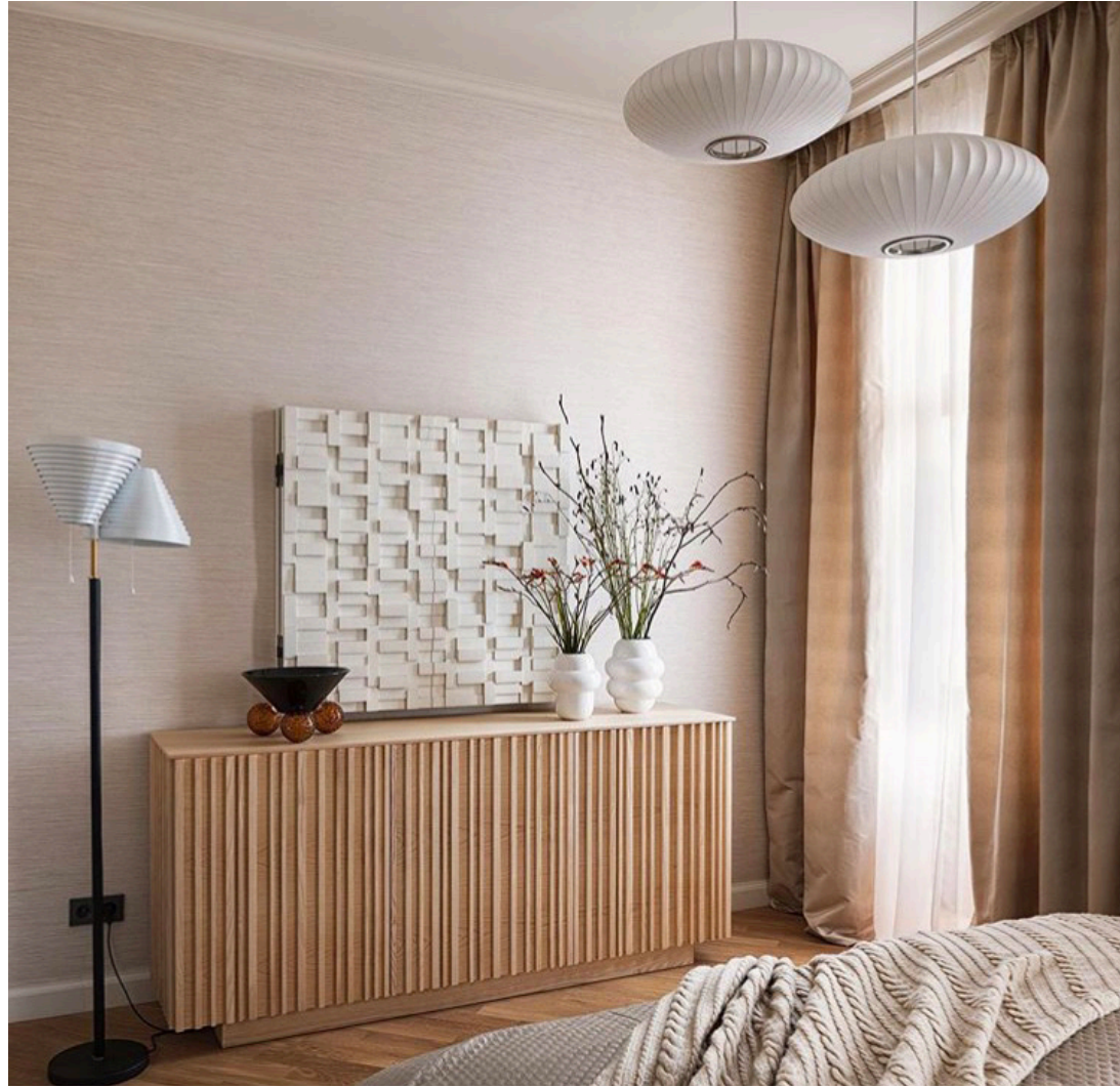
Private flat Paris