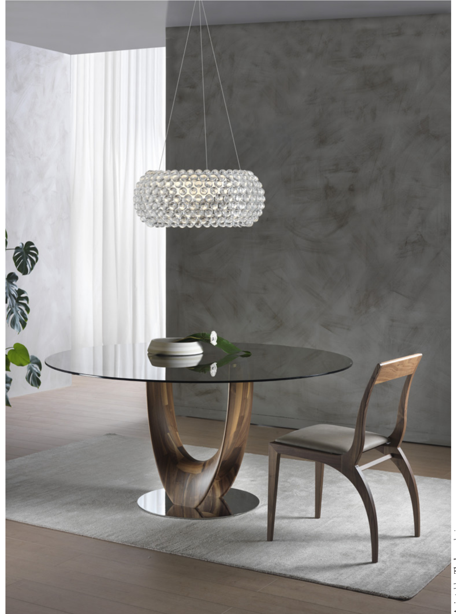
Axis table_Thelma chair