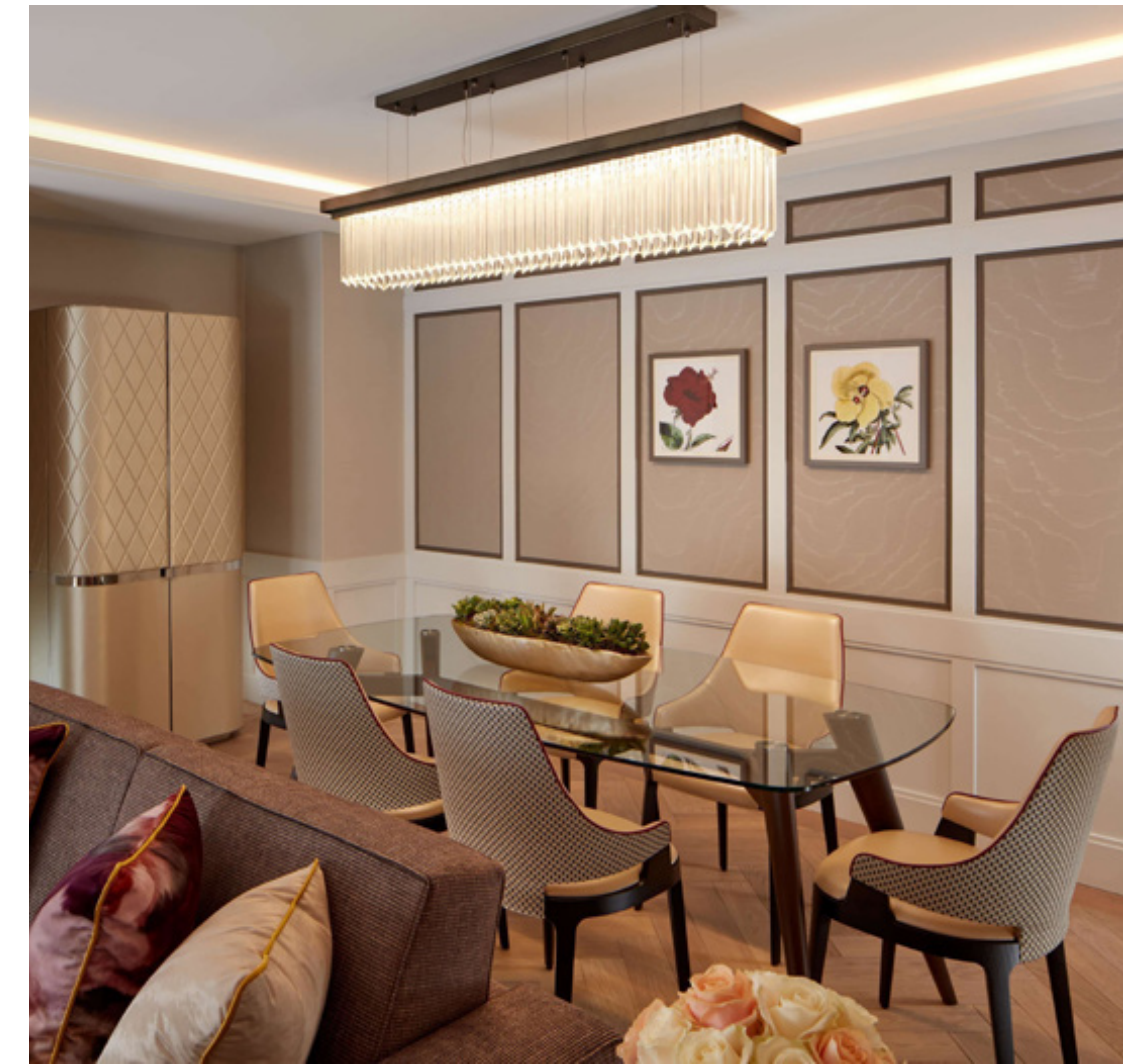
The Biltmore Hotel London

Pacini & Cappellini works alongside architects and interior designers in the construction of apartments, hotels, resorts, yachts, public and private spaces of all kinds. From consulting to the creation of special models, the company has in recent years implemented its services in order to better meet the needs of the contract market. Declined in different environments, Pacini & Cappellini products are enhanced through the work of professionals.