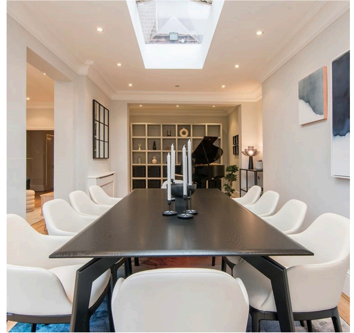
Private villa London