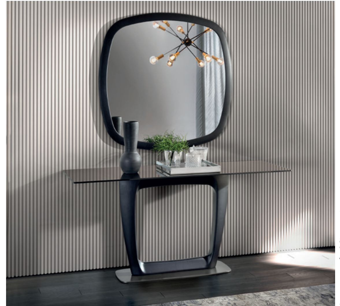
Aroon console_Mirage mirror