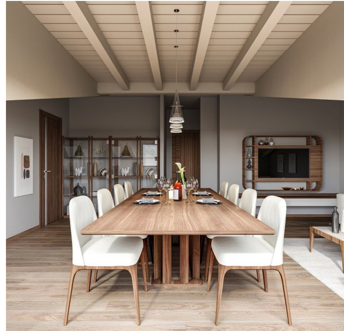
Private flat Siena