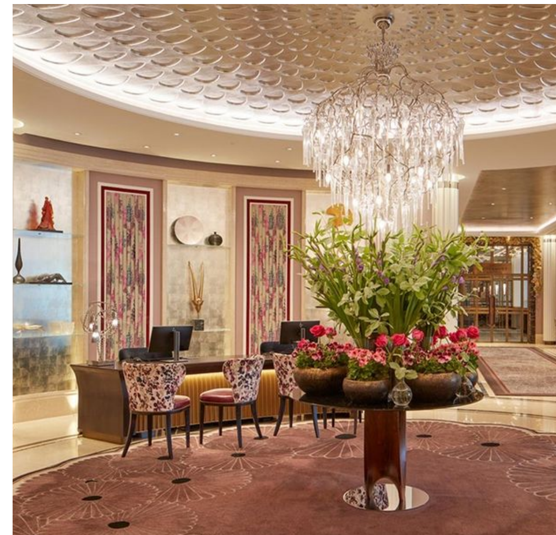
The Biltmore Hotel London