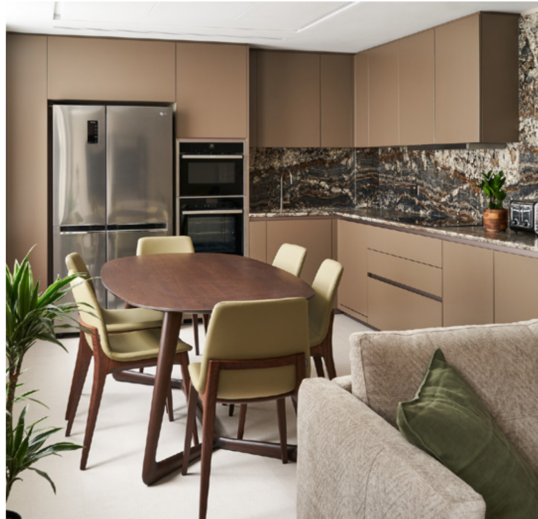
Private flat New York