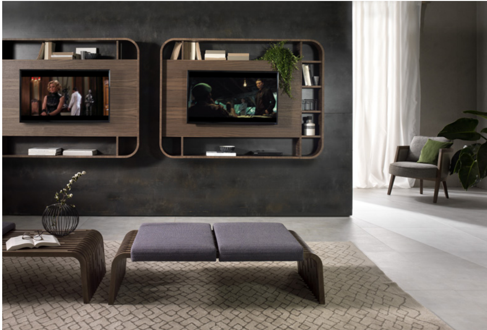
Millierighe coffetable_Vision tv stand_Cocoon

TABLES CHAIRS SOFAS BOOKCASES TV STANDS SIDEBOARDS DESKS COFFEE TABLES ACCESSORIES