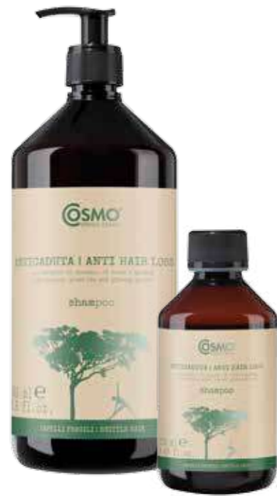
MG34 / MG33