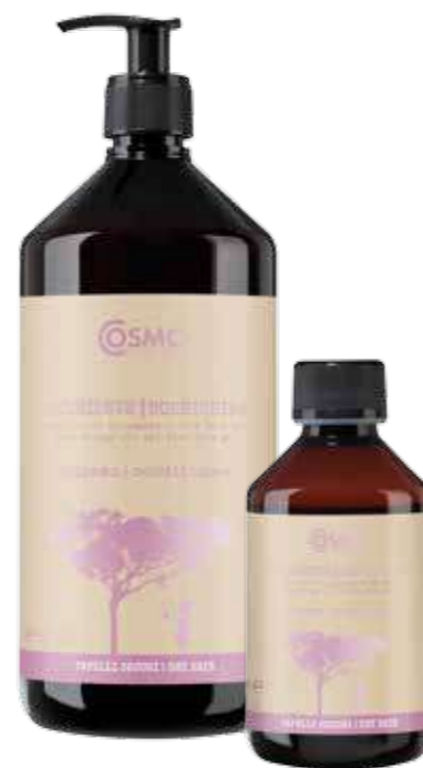
MG26 / MG25

After shampooing it adds hydration and softness without weighing the hair down. Wait 5/6 minutes and rinse.