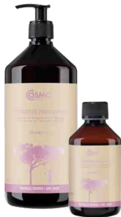
MG19 / MG20