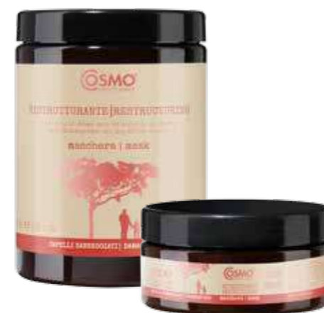
MG03 / MG04

Shock reconstructive treatment. After shampooing, on all the hair. Wait 5/6 minutes and rinse.