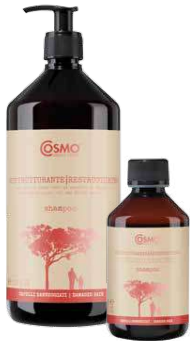
MG01 / MG02