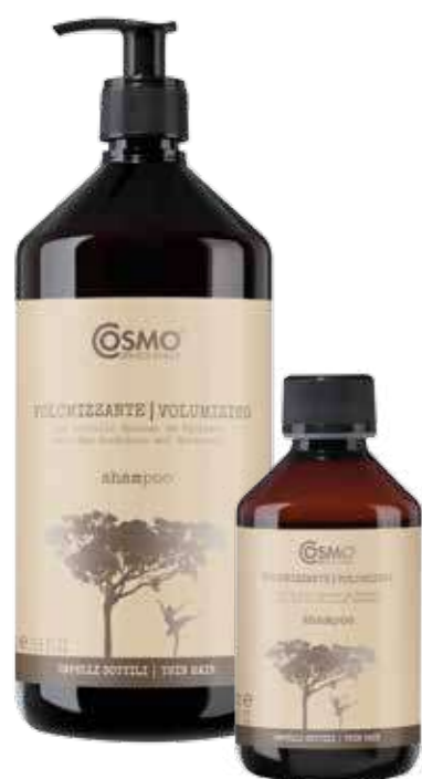
MG11 / MG12