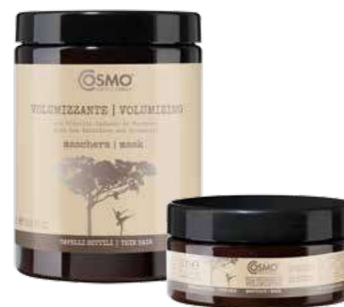
MG13 / MG14

Precious concentrate of 7 natural oils including Jojoba, Grape and Avocado. Anti-aging and long-lasting volume. Distribute on tips and lengths before or after styling.