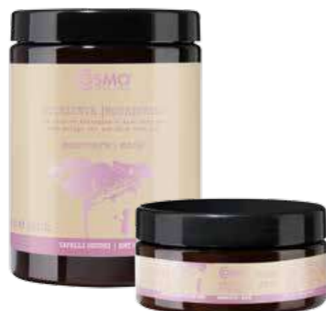
MG21 / MG22

Instant anti-frizzy effect. On damp hair, before styling, spray on lengths without rinsing.