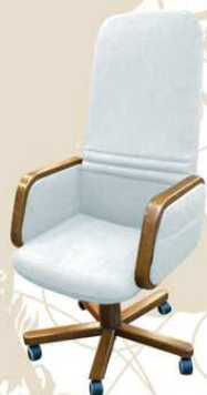
FOLLOW top class plus Poltrona da lavoro al tavolo

piazza s. onofrio, 82 (via sedile di porto) 80134 napoli - italy tel. 081 552.79.77 - fax. 081 552.77.00 www.vittoriopappalardo.com info@vittoriopappalardo.com unica sede