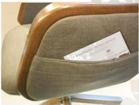
TASCA LATERALE: la tasca laterale al bracciolo è un comodo "svuota tasche".