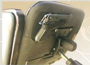
FONDINA PORTA PISTOLA: consente a chi è armato di potere, in fase di seduta, levare la pistola dalla cintola e riparla sotto la poltrona.