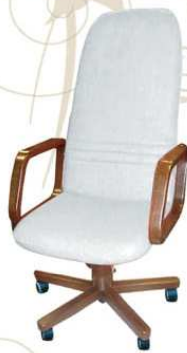
FOLLOW top class Poltrona da lavoro al tavolo