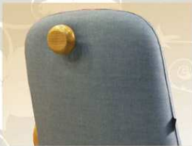
HOOK: è l'appendigiacca o appendiborsa da donna, sul retro della poltrona, al fine di nasconderla alla vista di chi è avanti a chi è seduto.