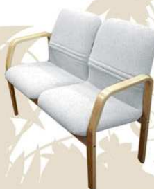
MEETING top class Divano attesa