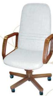
SENIOR top class Poltrona da lavoro al tavolo