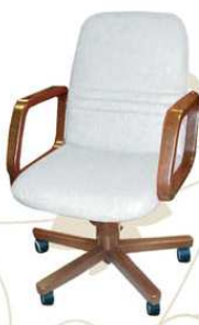
INPUT top class Poltrona da lavoro al tavolo / tavolo riunioni