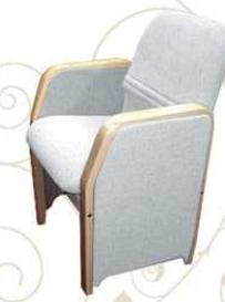
MEETING top class Poltrona ospite / attesa / tavolo riunioni