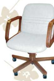
FIXING top class Poltrona da lavoro al tavolo / tavolo riunioni