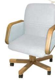
JUNIOR top class plus Poltrona da lavoro al tavolo / tavolo riunioni