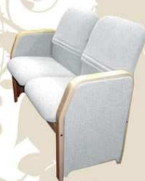
MEETING top class Divano attesa