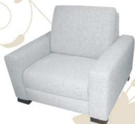
BROAD Poltrona attesa