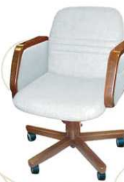
FIXING top class plus Poltrona da lavoro al tavolo / tavolo riunioni