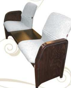
MEETING top class Divano attesa