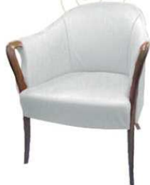
SUMMIT Poltrona ospite / attesa