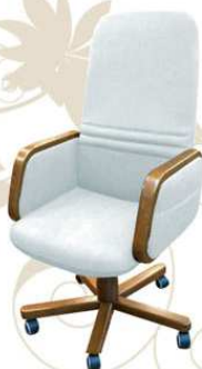
SENIOR top class plus Poltrona da lavoro al tavolo