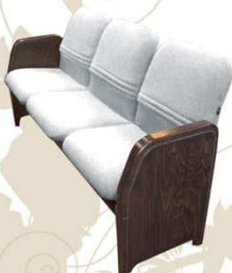
MEETING top class Divano attesa