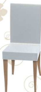
TRADE Poltrona ospite / attesa / tavolo riunioni