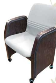
MEETING top class Poltrona da lavoro al tavolo / ospite / attesa / tavolo riunioni