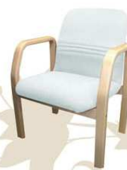
MEETING top class Poltrona ospite / attesa / tavolo riunioni

grafico: massimo caporaso