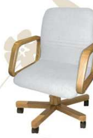
JUNIOR top class Poltrona da lavoro al tavolo / tavolo riunioni