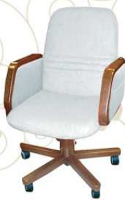
INPUT top class plus Poltrona da lavoro al tavolo / tavolo riunioni