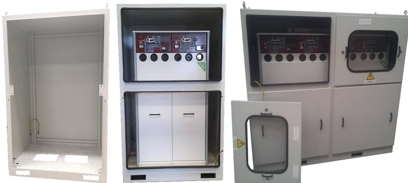
TMbox con quadro di distribuzione MT (RMU) TMbox with MV distribution switchgear (RMU)

I TMbox sono disponibili con le porte sul lato lungo o sul lato corto, in funzione delle esigenze del cliente.