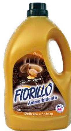
AMMORBIDENTE OLIO DI ARGAN

AMMU4 4 LT PZ/CT 4 CT/STRATO 9 CT/PALLET 45 EAN 8017412000889