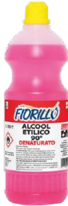
ALCOOL ETILICO 90°