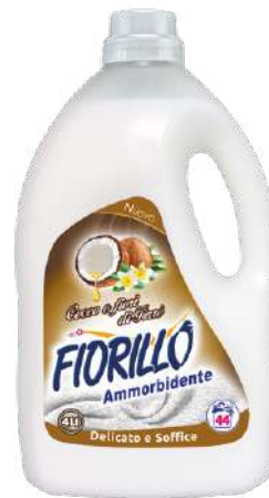
AMMORBIDENTE COCCO E TIARE'

AMAR4 4 LT PZ/CT 4 CT/STRATO 9 CT/PALLET 45 EAN 8017412003491