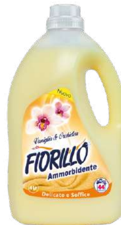
AMMORBIDENTE VANIGLIA E ORCHIDEA

AMFI4 4 LT PZ/CT 4 CT/STRATO 9 CT/PALLET 45 EAN 8017412001626