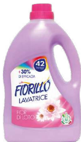
LAVATRICE FIOR DI LOTO

LAAR2.5 2.5 LT PZ/CT 6 CT/STRATO 10 CT/PALLET 50 EAN 8017412003408