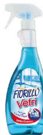
VETRI E SPECCHI