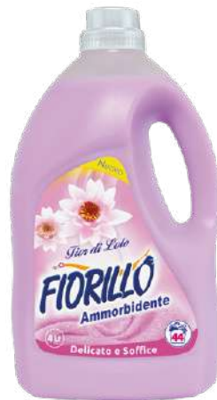
AMMORBIDENTE FIOR DI LOTO

AMFI4 4 LT PZ/CT 4 CT/STRATO 9 CT/PALLET 45 EAN 8017412001626