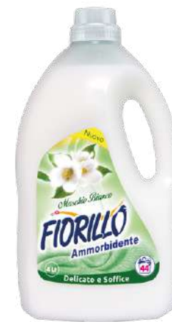
AMMORBIDENTE MUSCHIO BIANCO

AMVA4 4 LT PZ/CT 4 CT/STRATO 9 CT/PALLET 45 EAN 8017412003149