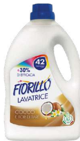
LAVATRICE COCCO E TIARÈ

LAFI2.5 2.5 LT PZ/CT 6 CT/STRATO 10 CT/PALLET 50 EAN 8017412001619