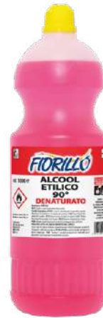
ALCOOL ETILICO 90°