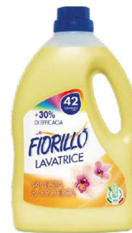
LAVATRICE VANIGLIA & ORCHIDEA

LACO2.5 2.5 LT PZ/CT 6 CT/STRATO 10 CT/PALLET 50 EAN 8017412004184