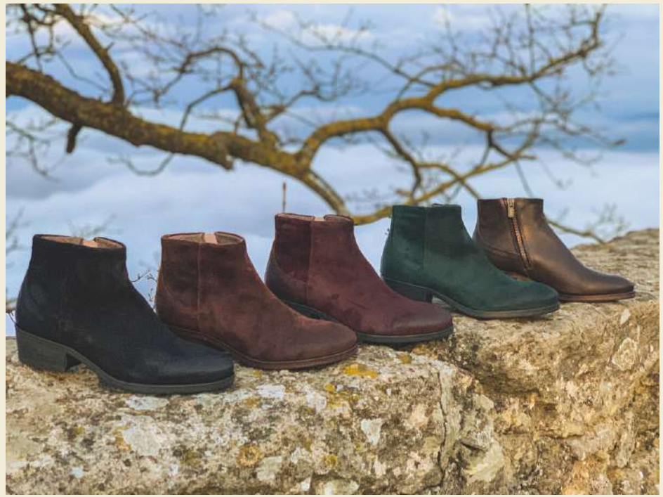
WAXED SUEDE & CALF LEATHER BOOTS WITH CASHMERE LININGS FOR MEN AND WOMEN