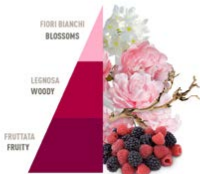
Petali di Peonia