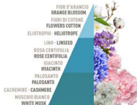
Lino e fior di cotone