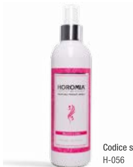
Codice sku H-056

Nota olfattiva fiorita, legnosa. Flowery, woody.