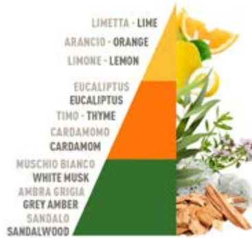
All'ombra degli aranci