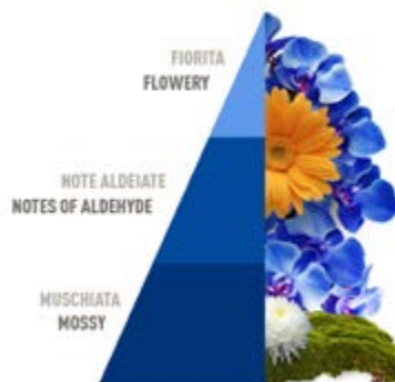
Blue Fior di loto