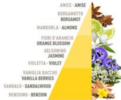
Vaniglia e benzoino