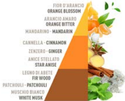
Arancio e cannella

8 essenze esclusive composte da oli sintetici e naturali, create per garantire un profumo intenso e duraturo. 8 exclusive essences composed of synthetic and natural oils, created to ensure an intense and long-lasting scent.