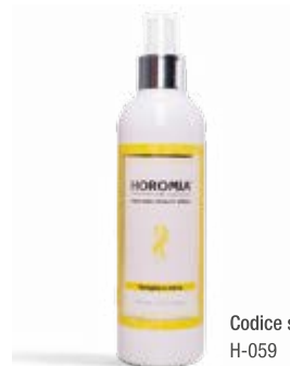
Codice sku H-059

Nota olfattiva fiorita, fresca. Flowery, fresh.