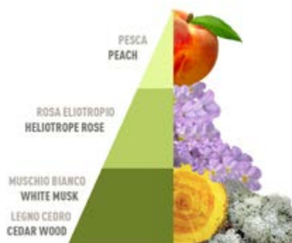
Musica del Sole