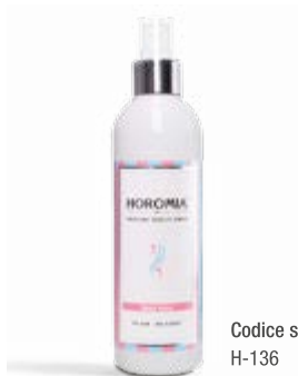
Codice sku H-136

Nota olfattiva fiorita, fresca, agrumata. Flowery, fresh, citrusy.