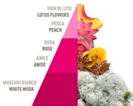
Muschi e Loto