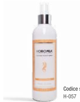
Codice sku H-057

Nota olfattiva fresca, fiori bianchi, fruttata. Fresh, blossoms, fruity, woody.