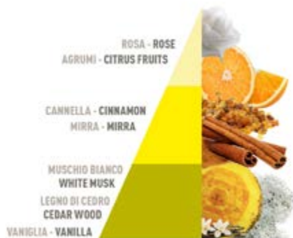
Vaniglia e Mirra