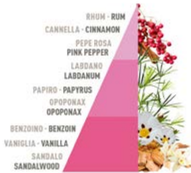
Sandal e pepe rosa