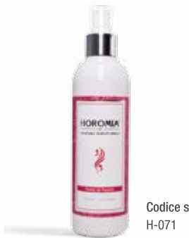
Codice sku H-071