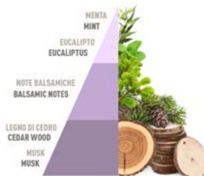
Brezza di Primavera