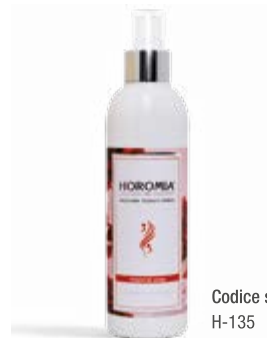
Codice sku H-135

Nota olfattiva fiorita, fresca, muschiata. Flowery, fresh, mossy.