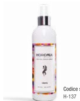
Codice sku H-137

Nota olfattiva fiorita, talcata. Flowery with notes of talc.