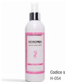
Codice sku H-054

Nota olfattiva dolce, fruttata, vanigliata. Sweet, fruity, with notes of vanilla.