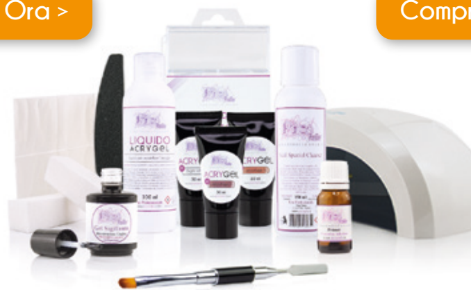
Kit Acrygel Plus