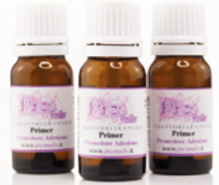
Primer - preparatore per unghie 10ml

Utilizzare il nail prep, il deidratante per unghie, come preparatore dell'unghia naturale e successivamente applicare il Primer.