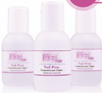
Nail Prep - preparatore per unghie 50ml