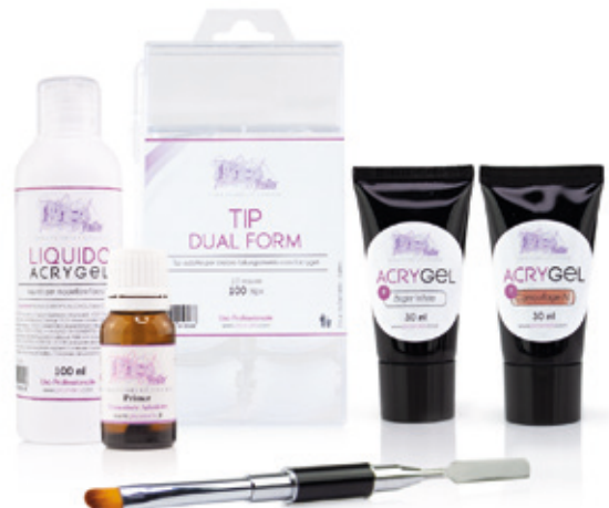
Kit Acrygel Base