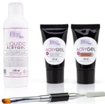
Kit Acrygel Essenziale

Acquista i Kit Acrygel completi del necessario per una Ricostruzione Unghie con l'Acrygel.