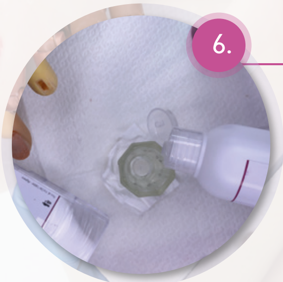
Liquido per Acrygel 100ml

Versare in un bicchierino di vetro il liquido per Acrygel, indispensabile per inumidire le setole del pennello con cui si modellerà l'Acrygel.