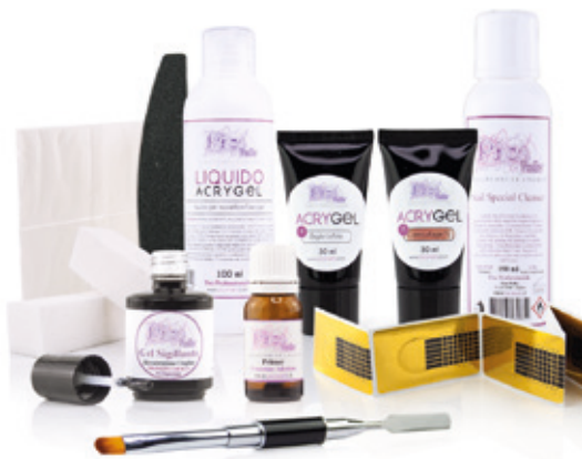
Kit Acrygel Starter