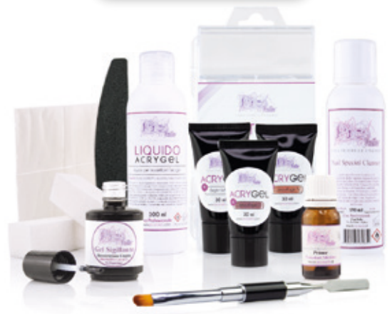
Kit Acrygel Medium