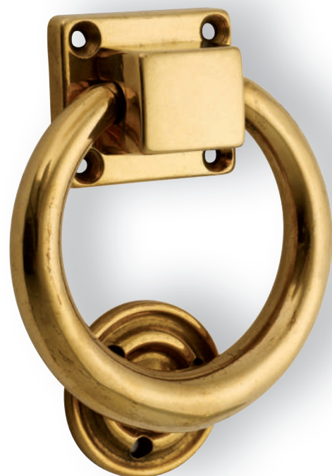
Art.300 ▶ Battaglio in ottone antichizzato per portone d'ingresso ▶ Tipo IMPERO ▶ Antique brass knocker for entrance door ▶ IMPERO type