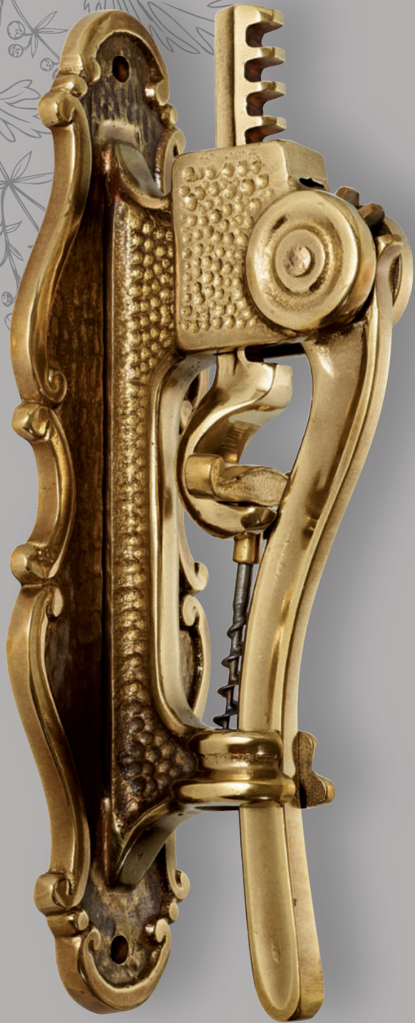
Art.305 ▶ Cavatappi a muro in ottone antichizzato ▶ Antique brass wall corkscrew