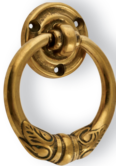
Art.295 ▶ Battaglio in ottone antichizzato per portone d'ingresso ▶ Tipo LUIGI XVI ▶ Antique brass knocker for entrance door ▶ LUIGI XVI type