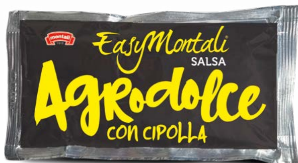
AGRODOLCE con cipolla