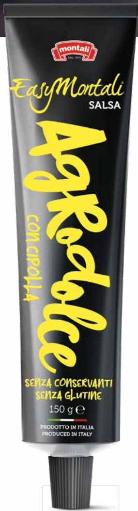
AGRODOLCE con cipolla