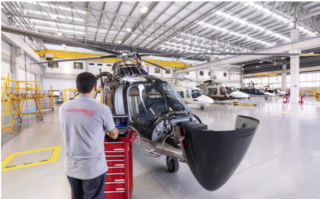
Figura 5: Helicopter Training Academy creata da Leonardo in Malesia

A giugno 2019 l'azienda italiana Leonardo e l'azienda malese PWN Excellence Sdn Bhd hanno annunciato un ampliamento della loro partnership per la fornitura di servizi di formazione avanzata, che includeranno anche servizi relativi al simulatore "Full Flight" di AW189, a complemento dei servizi già forniti dalla Leonardo Helicopter Training Academy creata in Malesia nel 2012.