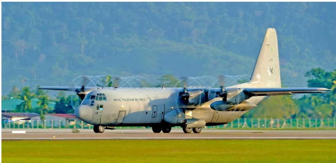
Figura 7: Partnership tra Honeywell e aziende locali per servizi MRO su licenza per le piattaforme per aerei C-130