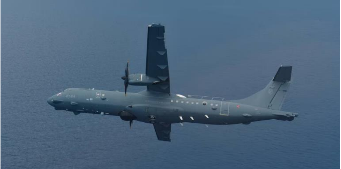
Figura 4: ATR 72MP, aereo a doppia turboelica in grado di eseguire missioni di pattugliamento in mare