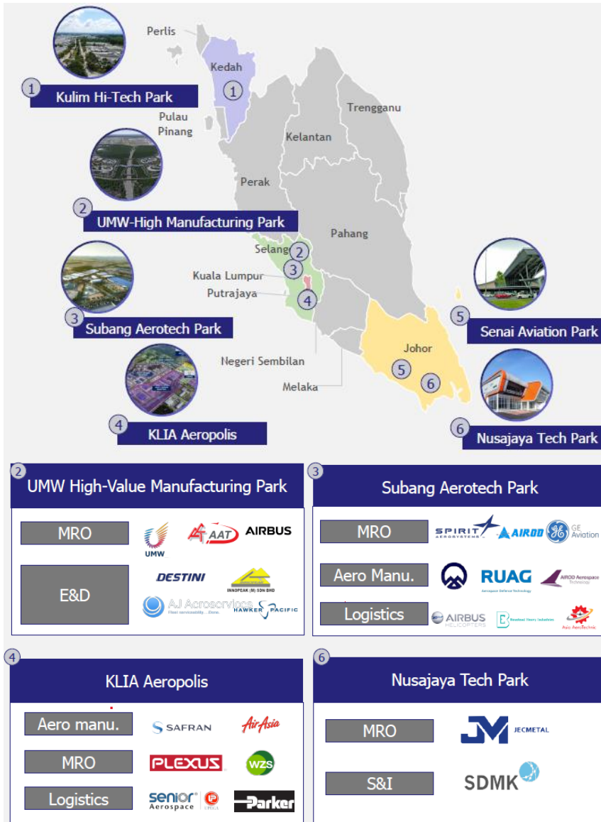
Figura 2: Cluster aerospaziali principali

Fonte: Ministry of International Trade and Industry (MITI) (Ministero dell’Industria e del Commercio Internazionale), Malesia