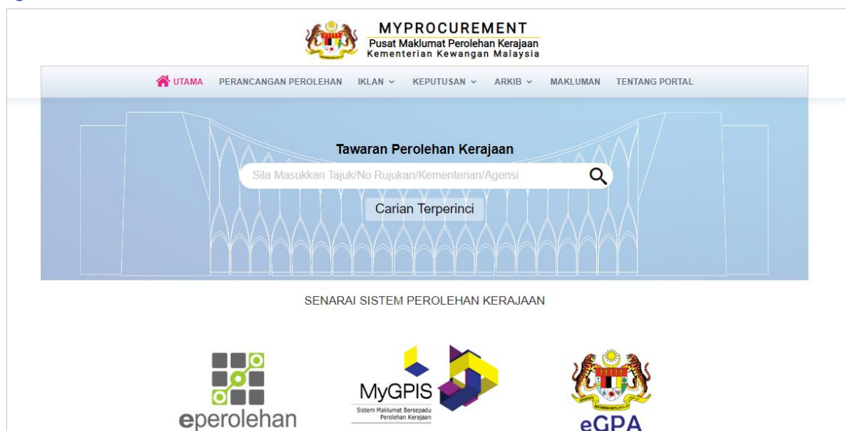
Figura 8: Portale di eProcurement del MOF