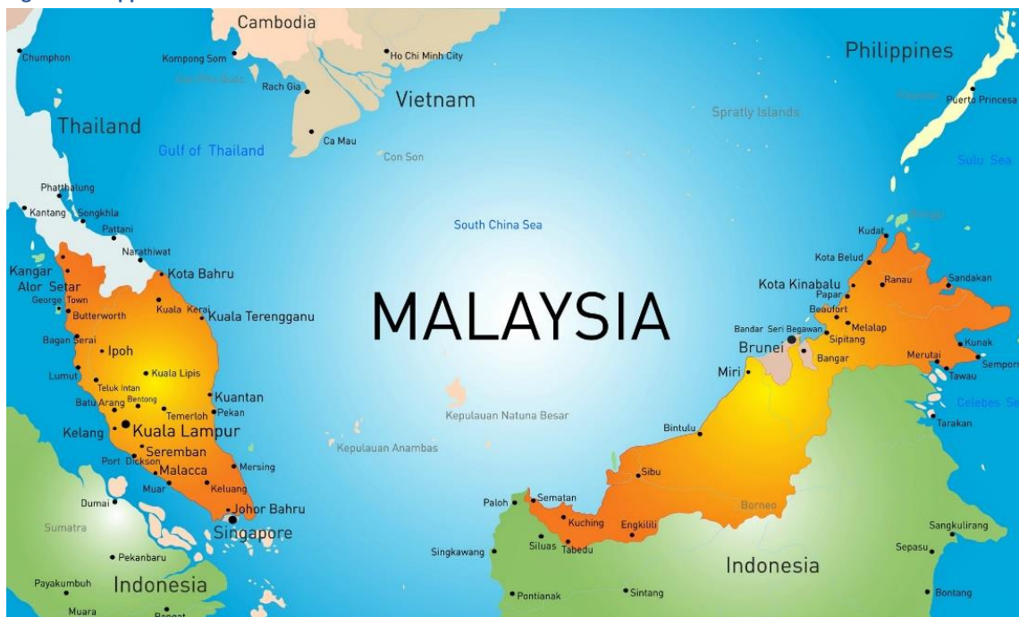
Figura 1: Mappa della Malesia

La Malesia presenta una geografia unica. La Malesia peninsulare è collegata alla Thailandia tramite l'Istmo di Kra, una stretta striscia di terra della Thailandia meridionale che collega la penisola malese all'Asia continentale. La Malesia orientale è composta da due stati, Sabah e Sarawak, situati al largo sull'isola di Borneo, occupata per la parte restante da Brunei e dalla regione indonesiana di Kalimantan. La Malesia possiede lunghe linee costiere, ampie zone economiche esclusive (ZEE) marittime e piattaforme continentali nel Mar Cinese Meridionale e nel Mar di Sulu e controlla parzialmente i choke point strategici dello Stretto di Malacca e degli Stretti di Johor.