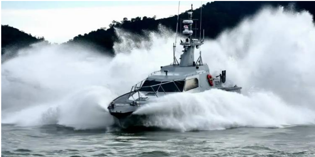
Figura 6: Nel 2022 Gading Marine ha fornito sei FIC alla Royal Malaysian Navy (Marina militare reale malese)