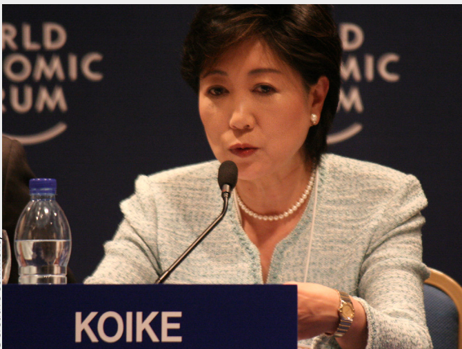
Yuriko Koike, governatrice di Tokyo

Parigi ha una grande responsabilità: i Giochi Olimpici e Paralimpici del 2024 saranno il primo grande evento mondiale post-Covid e un evento significativo nella ripresa economica di Parigi, dell'Ile de France e di tutta la Francia.