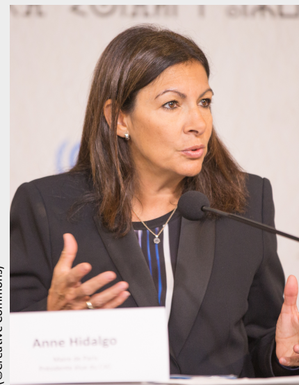
Anne Hidalgo, sindaca di Parigi.