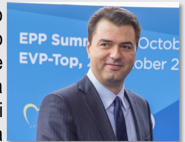
Lulzim Basha Leader del Partito Democratico (centro destra)

Il Partito Democratico albanese, principale forza politica dell'opposizione di centro destra, ha deciso, in seguito alla manifestazione del 16 febbraio contro il governo Rama, di rimettere i mandati parlamentari dei propri membri. La notizia è stata resa nota dal leader del partito Lulzim Basha. Alla decisione si sono aggiunti anche gli altri partiti dell'opposizione tra cui il Movimento Socialista per l'Integrazione, partito di centro sinistra.