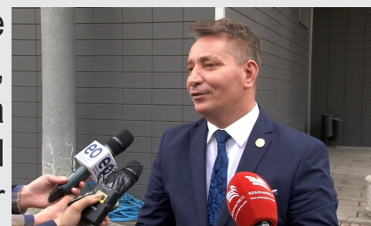
Pal Lekaj Ministro delle Infrastrutture

Il Ministro delle infrastrutture, Pal Lekaj, ha firmato il contratto per l'avvio dei lavori di costruzione della prima tratta della strada Deçan-Plavë. L'azienda aggiudicataria è Lika Trade Sh.p.k. per un valore i oltre 4 milioni di euro. In occasione della firma il Ministro ha dichiarato che l'intero progetto ha un valore di circa 12 milioni di euro e i lavori inizieranno a marzo di quest'anno. La costruzione della strada collegherà il Kosovo con il Montenegro, incidendo positivamente sullo sviluppo del turismo, uno dei settori più rilevanti per la città di Deçan.