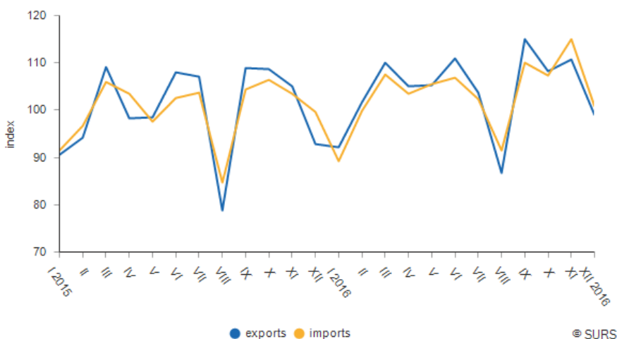
Indici esportazioni e importazioni (Ø 2015=100), Slovenia

Dicembre, ultimo mese di rilevazione, è stato in questo contesto uno dei mesi meno favorevoli ma comunque in crescita rispetto al dicembre 2015 sia verso il mercato UE che extra UE, con esportazioni del valore di 1,97 miliardi di euro (+6,6%), importazioni per 1,95 miliardi (+1,1%) e un avanzo della bilancia commerciale di 18,8 milioni di euro (tasso di copertura 101%). Il valore delle esportazioni è stato inferiore alla media mensile 2015 dell'1%, quello delle importazioni superiore dello 0,7%. Il 72.1% delle esportazioni e il 79.9% delle importazioni hanno riguardato il mercato UE (con un incremento del 6,6% nelle esportazioni e una contrazione dello 0,5% delle importazioni rispetto a dicembre 2015). Esportazione e importazioni verso e dai mercati extra UE sono entrambe aumentate, rispettivamente del 6,3 e dell'8%, raggiungendo i valori di 550,5 e 393.6 milioni di euro.